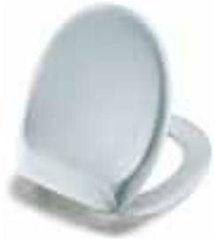
Profil hvid Profil vit Profil weiß Profil white